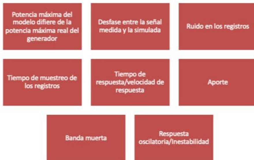
Figura 3. Patrones definidos para el seguimiento a modelos.

A continuación se presenta la definición de los patrones definidos para el proceso de seguimiento a la calidad de los modelos: