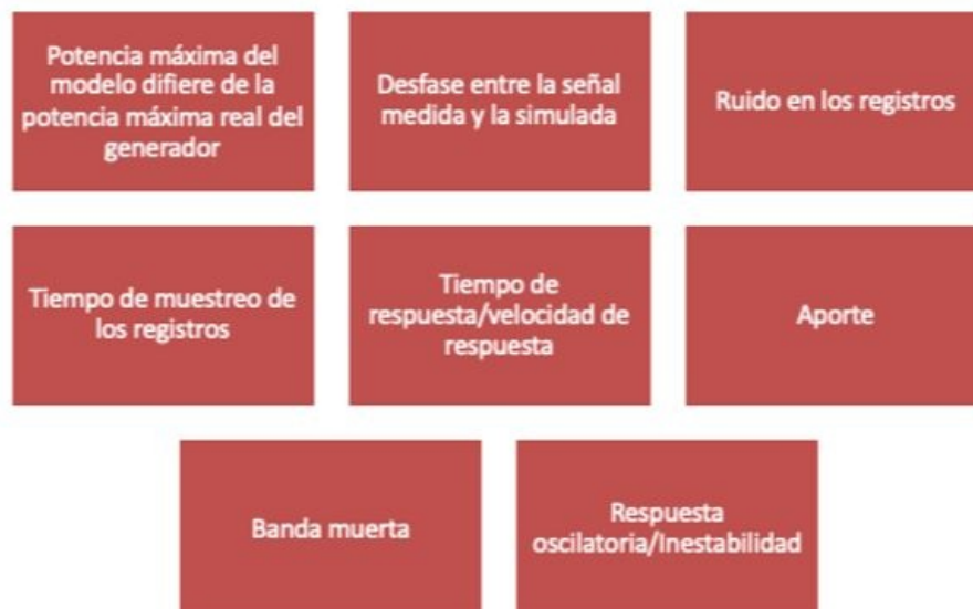
Figura 3. Patrones definidos para el seguimiento a modelos.

A continuación, se presenta la definición de los patrones definidos para el proceso de seguimiento a la calidad de los modelos: