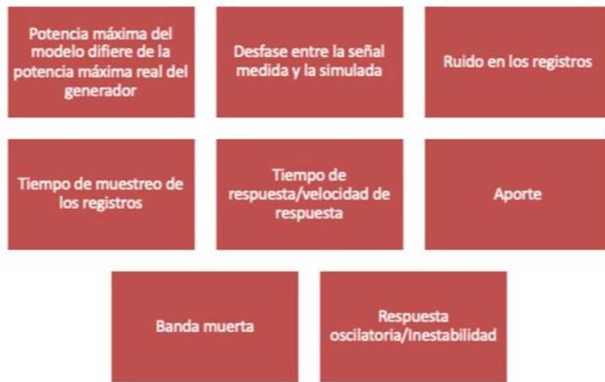
Figura 3. Patrones definidos para el seguimiento a modelos.

A partir de la reunión de revisión se definirá si la respuesta inadecuada del modelo puede ser resuelta a través de un reajuste de parámetros o si se requiere actualizar el modelo de control. Para el primer caso, el CND en conjunto con el agente realizarán un ajuste del modelo sin la obligatoriedad de realizar pruebas adicionales. Luego del ajuste del modelo se continuará con el proceso de seguimiento como si hubiese sido actualizado el modelo. En caso de que se realice en dos ocasiones consecutivas el ajuste de los parámetros del modelo y no se logre el cumplimiento de indicadores asociados a un mismo patrón, será necesario realizar una actualización del modelo teniendo en cuenta los plazos definidos en el artículo sexto del presente Acuerdo para el caso de Desempeño inadecuado de modelos. Adicionalmente, el CND deshabilitará los modelos de control en el modelo eléctrico oficial del SIN.