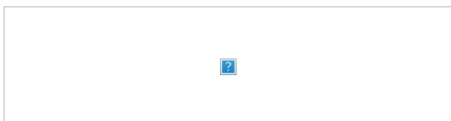
Figura 2. Diagrama unifilar para modelo eléctrico de generadores eólicos y solares conectados al STN, STR y SDL

Adicionalmente, debe tenerse en cuenta el siguiente diagrama unifilar y las definiciones de unidad equivalente para Fuentes de Energía Renovables No Convencionales (FERNC):